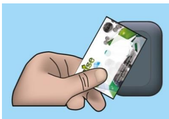
Figur 1 Misekortet används som nyckel till låsta återvinningsstationer, Låsta hus, Mise ÅVC (återvinningscentral) och Misenbilen (mobil ÅVC).

En betald avfallsavgift (grundavgift och rörlig avgift) ger rätt till ett Misekort. Misekortet är en värdehandling som enbart gäller för den bostad som Misekortet blivit tilldelad. Misekortet fungerar som en nyckel vid återvinningscentral (ÅVC), återvinningsstationer (ÅS), Låsta hus och ska alltid uppvisas vid Mise ÅVC och Misenbilen. För ej uppvisat Misekort debiteras en avgift enligt Mises avfallstaxa.